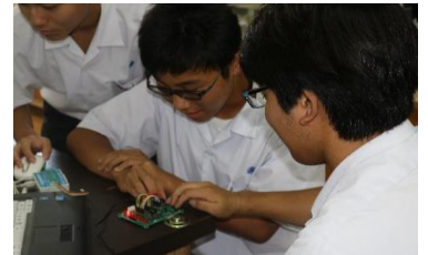
プログラミングセミナー

【理数科】1年次より数学・理科を多く学ぶことができることが特徴です。数学や理科、英語、国語で1クラスを2つに分けて行う少人数制授業を行っています。また、将来、大学や社会で活躍できる人材を育成するため、大学と連携した実習や研修旅行(2年生、2泊3日)、自ら設定したテーマについて研究活動を行う、課題研究(2年生)を実施しています。今年度は、「海洋科学セミナー(2年生、九州大学)」、「プログラミングセミナー(1・3年生、九州工業大学)」、「金属解析セミナー(1年生、九州大学)」、「電子顕微鏡実習(1年生、福岡工業大学)」、「天体観測実習(1年生、福岡教育大学)」を行います。各実習の終わりや課題研究発表会(2月)で成果を発表するなど表現力の育成に力を入れています。